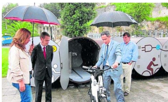
La alcaldesa y el delegado de la empresa visitaron uno de los depósitos de bicis. P.A.

La villa contará con una decena de bicis eléctricas